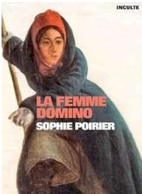
« La femme domino », Inculte éditions, 2024

Elle participe à la rédaction et à la conception de nombreux ouvrages, des chroniques (sur le webzine Station Ausone). Elle est animatrice d'ateliers d'écriture.